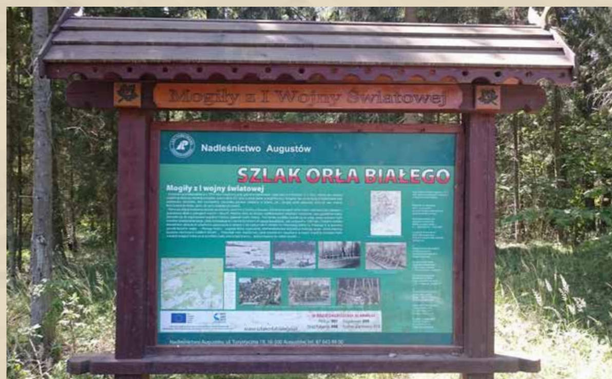
Источники (на польском языке): Список, стр. 94; Мацкевич Й. Военные кладбища периода I мировой войны..., стр. 199; Не спрашивайте..., стр. 21; Карточка кладбища. Военное кладбище I мировой войны в урочище Бяла-Глина, 1998 (Представительство Службы охраны памятников в Сувалках).